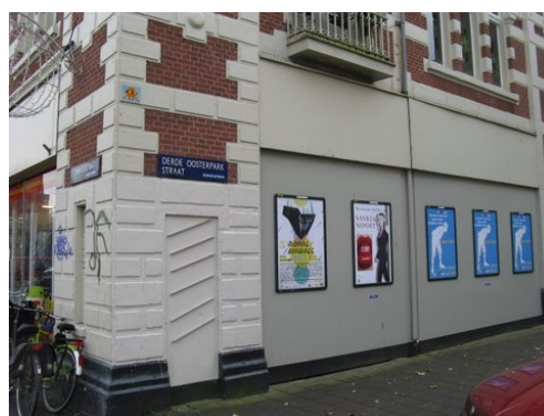
Wildplakprobleem opgelost met frames voor culturele affichage