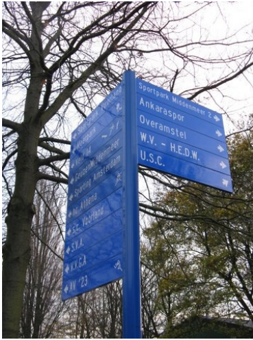
Verwijsbord naar sportverenigingen

Op Amstel Business Park voorziet een collectief bewegwijzeringssysteem naar straten grotendeels in de behoefte aan verwijzingen. Ook op sportparken kunnen collectieve verwijzingen naar de verenigingen worden geplaatst.