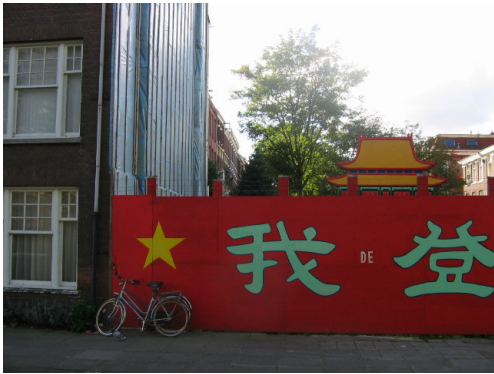
Bouwschutting met kunst in opdracht,