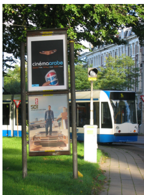
Oude reclamedragers: inmiddels verwijderd