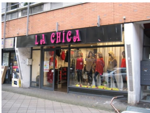
Rustig beeld: Losse letters op de juiste plaats

Ook als er geen omgevingsvergunning nodig is, moet van de reclame-uiting zelf toch bepaald worden of deze toelaatbaar is. In de APV en in deze nota staat wat wel en wat niet toelaatbaar wordt geacht. Als dat niet helemaal duidelijk is, moet een melding worden gedaan bij het stadsdeel. Als het dagelijks bestuur de voorgestelde reclame niet toelaatbaar acht, laat het dit de aanvrager binnen vijf weken weten. In het andere geval kan de reclame als wel toelaatbaar worden beschouwd. Ook voor het toetsen van deze melding gelden de regels in de Welstandsnota als toetsingscriterium.