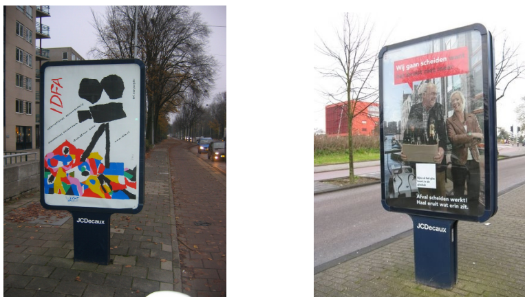
Mupi's, zoals ze er tot medio 2012 uitzien

Eind jaren tachtig zijn alle bus- en tramhalte hokjes vervangen. Deze 'abri's' worden beheerd door een reclame-exploitant, momenteel JCDecaux, die de hokjes schoonhoudt en daarvoor reclame mag aanbrengen. Aanvullend is een contract gesloten voor plaatsing van staande vitrines, de zogenaamde mupi's. Aan de voorzijde hangt reclame, aan de achterkant culturele affichage en in een aantal gevallen een plattegrond van het deel van de stad waar de mupi staat. In stadsdeel Oost meestal de kaart 'Oost', maar voor IJburg wordt vanwege de perifere ligging een aparte kaart voorbereid. Deze kaarten worden iedere vier jaar geactualiseerd.