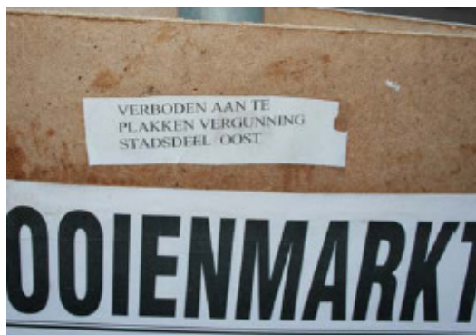
Sandwichbord aan paal: bij hoge uitzondering toegestaan