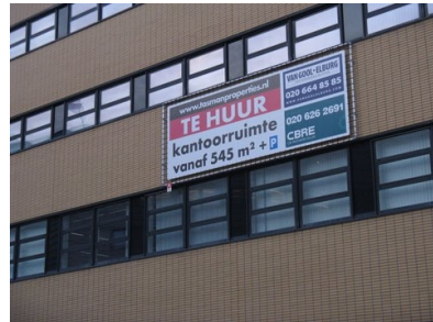
verkoopdoek van bescheiden omvang