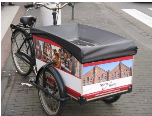
Een fiets of een reclame-object?

Artikel 4.23 verbiedt het zonder ontheffing parkeren van voertuigen als deze voorzien zijn van een reclame-aanduiding en als dat het kennelijke doel heeft daarmee op dat moment reclame te maken. Zo mag een fiets, die als fiets in gebruik is, wel reclame bevatten, maar een permanent reclame-object in de vorm van een fiets, maar niet in gebruik als fiets, is niet toegestaan.