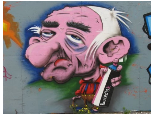
of met mooie graffiti-kunst.....