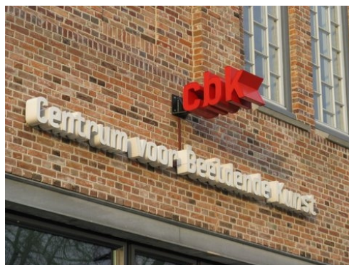
Kleine gevelreclame met respect voor de gevel